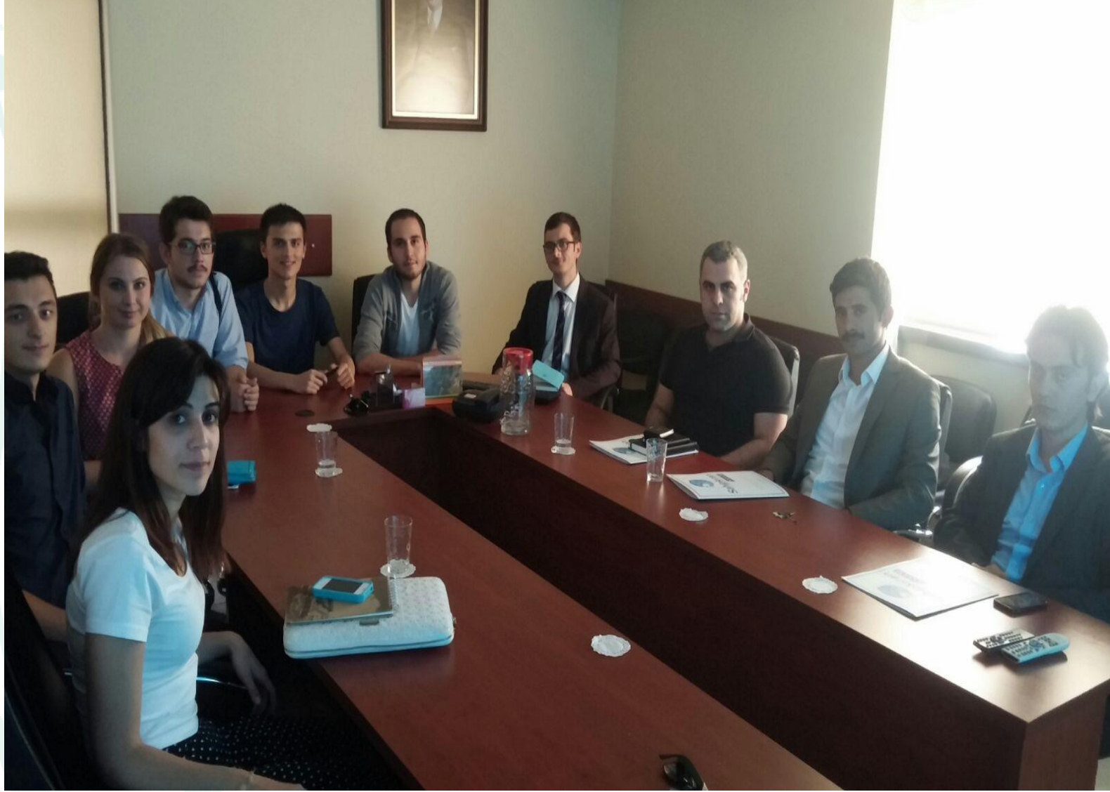
Koordinasyon Kurulunun Hazırlık Toplantısından Görüntü